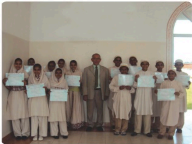
▲ Diplôme d'Etudes en Langue Française

Durant leur séjour dans cette serre, ils découvrent en fait l'immensité de l'Univers, la diversité du savoir et le foisonnement des connaissances.