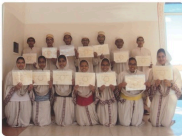
▲ DNB Session 2013