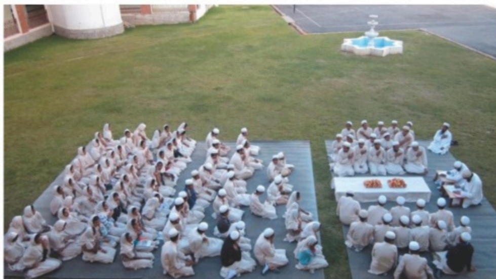
Séance de Qafeyah

Sous l'action de la lumière de la raison, les enfants émettent des rayonnements spirituels et intellectuels qui deviennent des phares dans ce jardin merveilleux de la vie.