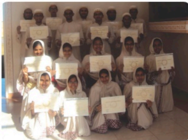
◀ Baccalauréat Session 2013

Les élèves acquièrent des principes solides, un mode de vie spécifique et maîtrisent des savoirs disciplinaires. Ils sont enfin prêts à s'envoler vers leur destinée.